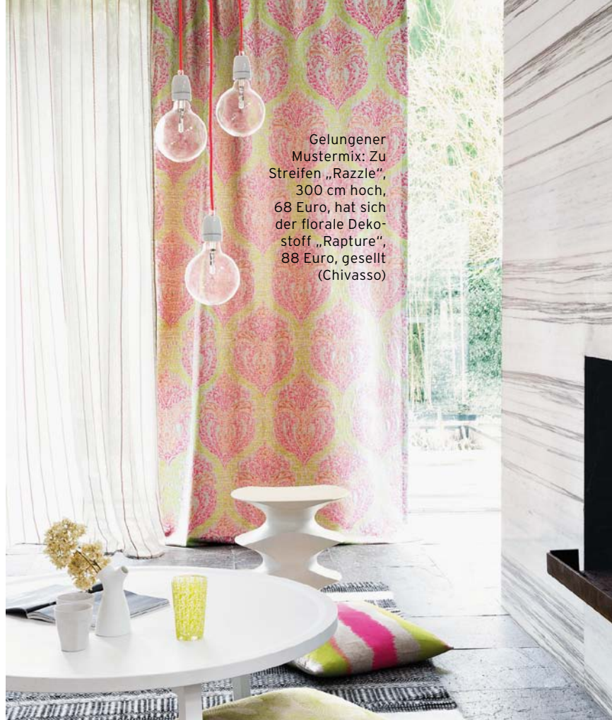
Gelungener Mustermix: Zu Streifen „Razzle“, 300 cm hoch, 68 Euro, hat sich der florale Dekostoff „Rapture“, 88 Euro, gesellt (Chivasso)

Caroline Clifton-Mogg sprüht vor Einrichtungsideen. Ihr Ziel: „Ein Zuhause zum Wohlfühlen“. Das schafft sie und bindet dabei auch den Bestand des Hauses mit ein. Ein wahrhaft wohnliches Lesevergnügen! Busse Seewald, ISBN 978-3-7724-7358-6, 22 Euro