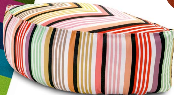
Outdoor? Indoor? Pouf „Blatt Overall“ kommt immer gerne überallhin mit, 120 x 60 cm, 660 Euro (Missoni Home)

Ein Leben in Würde und Individualität hauchen Bemz-Bezüge den Sofas von Ikea ein. www.bemz.com