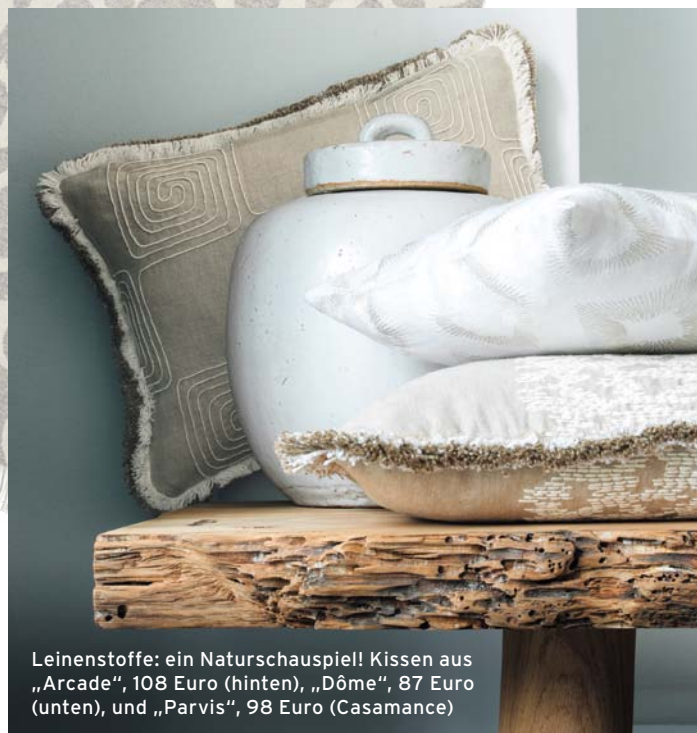
Leinwandstoffe: ein Naturschauspiel! Kissen aus „Arcade“, 108 Euro (hinten), „Dôme“, 87 Euro (unten), und „Parvis“, 98 Euro (Casamance)