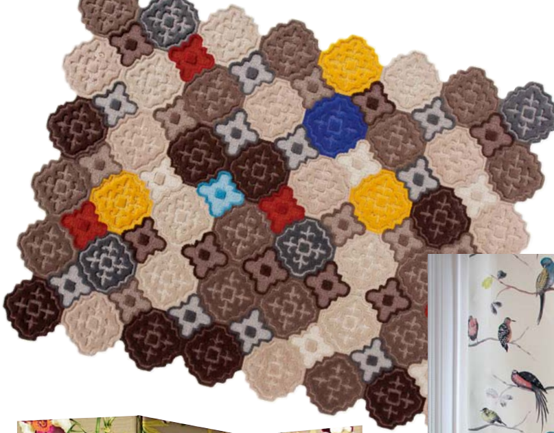
Patchworkteppich - mal ganz anders: „Hidra“ legt sich in zwei Größen lang, 180 x 240 cm und 225 x 300 cm, ab 1100 Euro (Gandia Blasco)