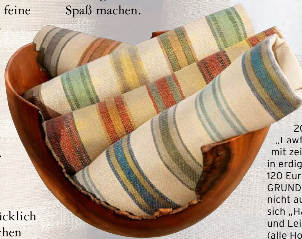
OBEN: Ringe aus Jute reihen sich auf Leinen-Grund „Alister“, 202 Euro. LINKS: „Lawford Stripe“ mit zeitlosen Streifen in erdigen Farben, 120 Euro. IM HINTERGRUND: Glamourös, aber nicht aufdringlich gibt sich „Halen“ aus Seide und Leinen, 161 Euro (alle Hodssoll McKenzie)