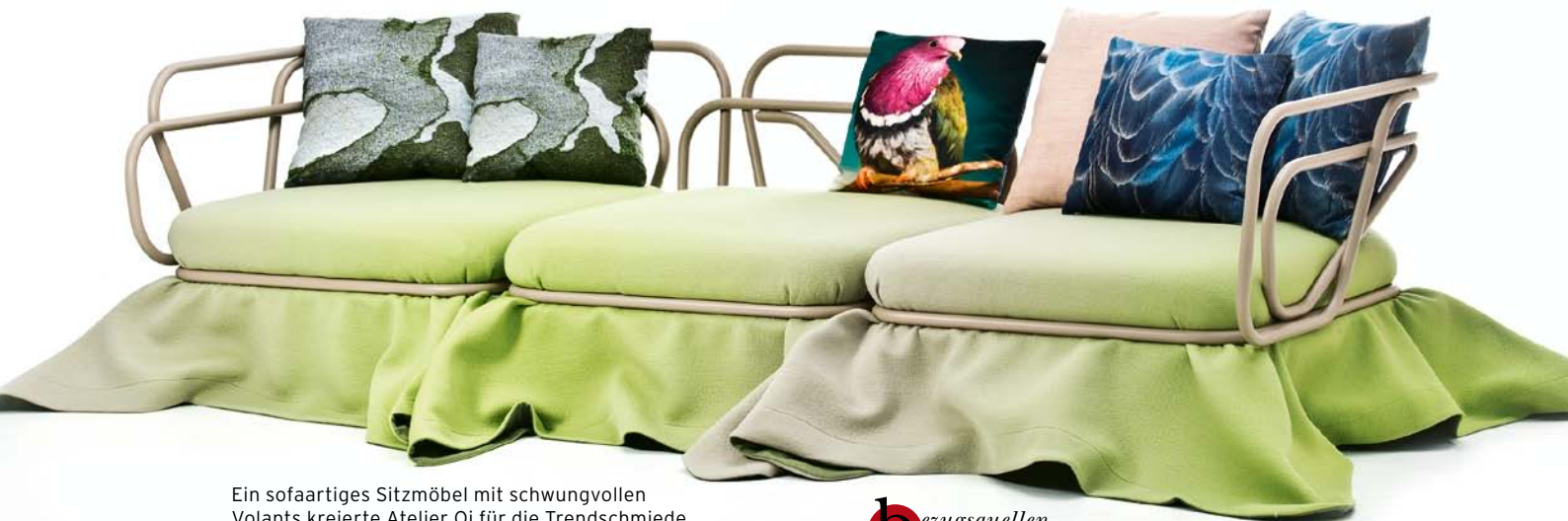
Ein sofaartiges Sitzmöbel mit schwungvollen Volants kreierte Atelier Oi für die Trendschmiede Moroso in Udine, 240 x 80 cm, Preis auf Anfrage