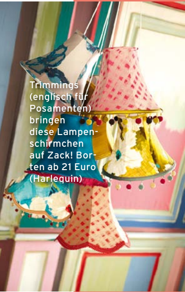
Trimmings (englisch für Posamenten) bringen diese Lampenschirmchen auf Zack! Borten ab 21 Euro (Harlequin)