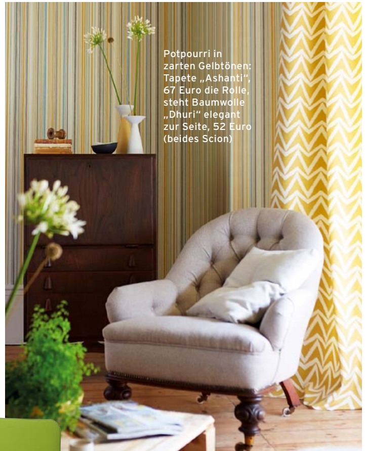
Potpourri in zarten Gelbtönen: Tapete „Ashanti“, 67 Euro die Rolle, steht Baumwolle „Dhuri“ elegant zur Seite, 52 Euro (beides Scion)