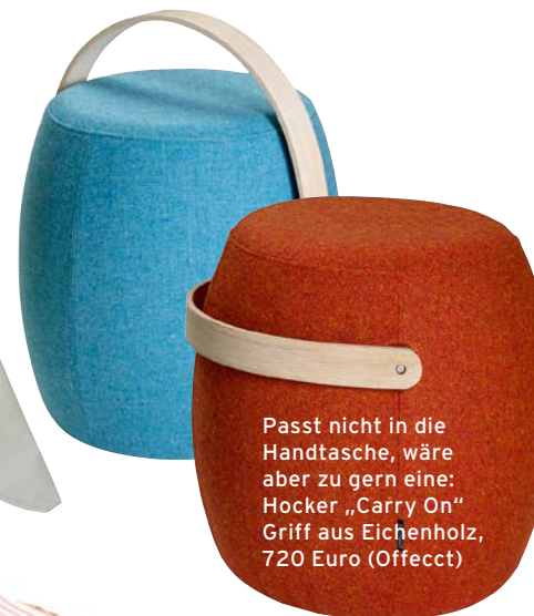
Passt nicht in die Handtasche, wäre aber zu gern eine: Hocker „Carry On“ Griff aus Eichenholz, 720 Euro (Offeffect)