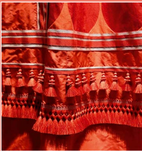
Meisterhaft: Die Geschichte der Posamenten-Manufaktur Houllès reicht bis ins 17. Jahrhundert zurück. Diesen Seidentaft veredeln Quasteborten aus Kollektion „Onyx“, bei denen die kleinen Quasten von Hand mit Effektgarn umwickelt und danach befestigt werden, ab 56 Euro

Fenster. Eine Fransenborte verleiht einem Kissen Lässigkeit, eine Keder-schnur dem Polstermöbel Kontur. Aber auch an kuscheligen Decken, Lampenschirmen, Tapeten, Teppichen oder Bettwäsche können Borten, kleine Quasten, Kordeln, Zierknöpfe oder Spitzen wirken. Ihre Blütezeit erlebte die Bandweberei im 19. Jahrhundert. Noch heute werden die feinen Schmuckwaren zum Teil in Handarbeit hergestellt - in modernen Farben und spannenden Texturen. So gefallen sie nicht nur Liebhabern der klassischen Dekoration.