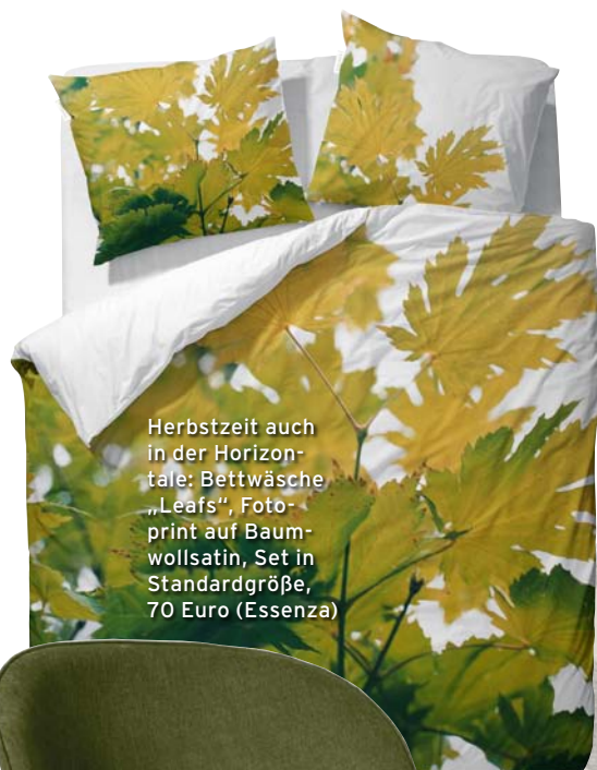
Herbstzeit auch in der Horizontale: Bettwäsche „Leafs“, Foto- print auf Baumwoll- satin, Set in Standardgröße, 70 Euro (Essenza)