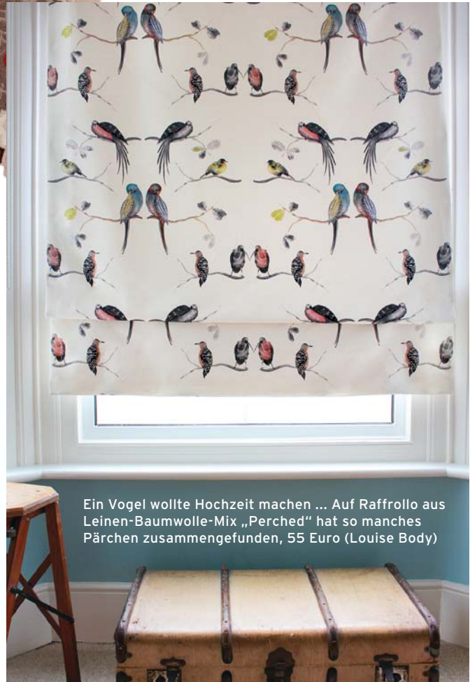
Ein Vogel wollte Hochzeit machen ... Auf Raffrollo aus Leinen-Baumwolle-Mix „Perched“ hat so manches Pärchen zusammengefunden, 55 Euro (Louise Body)