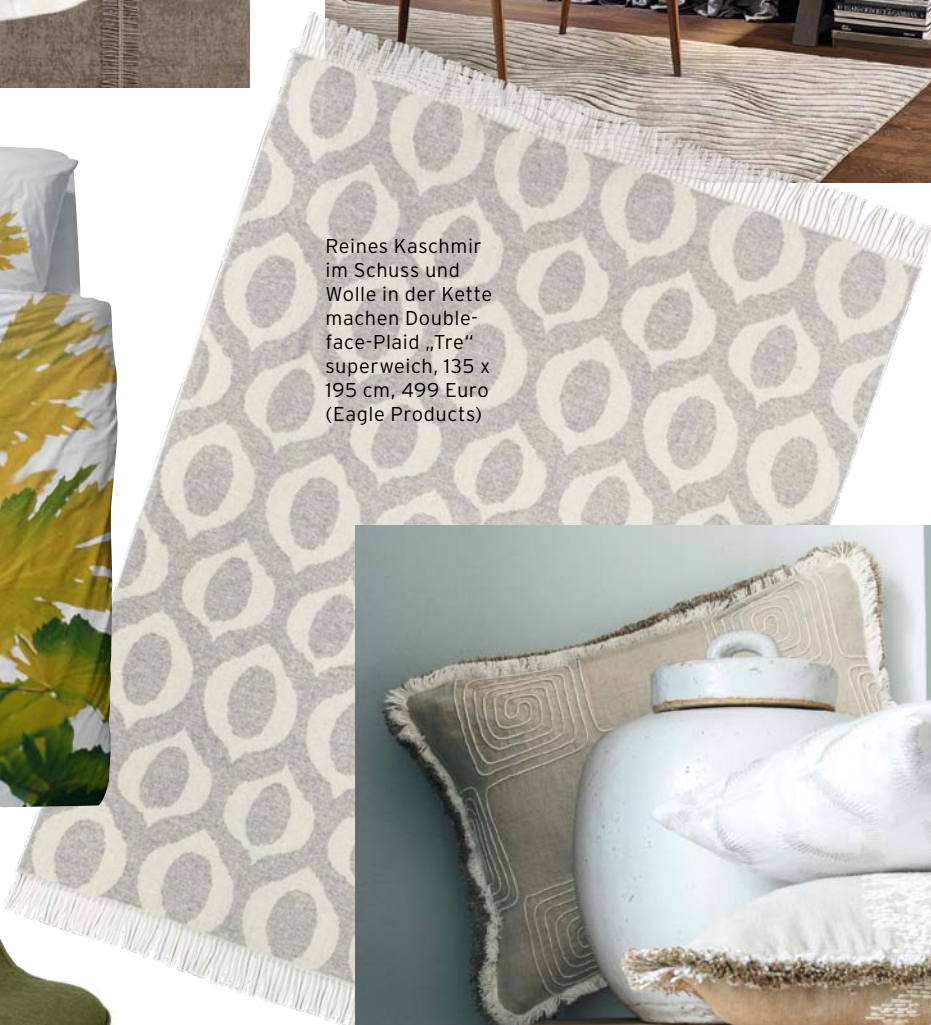
Reines Kaschmir im Schuss und Wolle in der Kette machen Double- face-Plaid „Tre“ superweich, 135 x 195 cm, 499 Euro (Eagle Products)