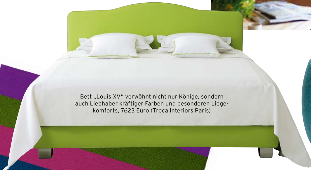
Bett „Louis XV“ verwöhnt nicht nur Könige, sondern auch Liebhaber kräftiger Farben und besonderen Liegekomforts, 7623 Euro (Treca Interiors Paris)