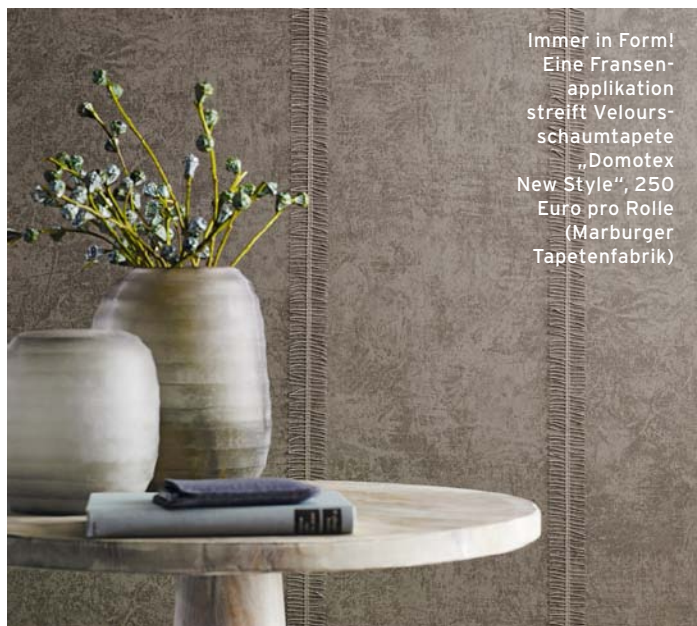
Immer in Form! Eine Fransen- applikation streift Velours- schaumtapete „Domotex New Style“, 250 Euro pro Rolle (Marburger Tapetenfabrik)