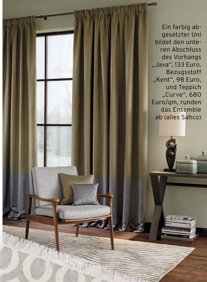
Ein farbig ab- gesetzter Uni bildet den unteren Abschluss des Vorhangs „Java“, 133 Euro. Bezugsstoff „Kent“, 98 Euro, und Teppich „Curve“, 680 Euro/qm, runden das Ensemble ab (alles Sahco)