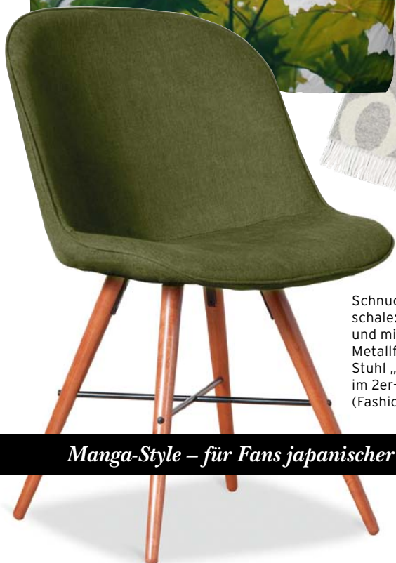
Schnuckelige Sitz- schale: In fünf Farben und mit Holz- oder Metallfüßen kommt Stuhl „Clam“ daher, im 2er-Set 399 Euro (Fashion for home)

Manga-Style – für Fans japanischer Zeichentrickfilme ein textiles Eldorado: www.modes4u.com