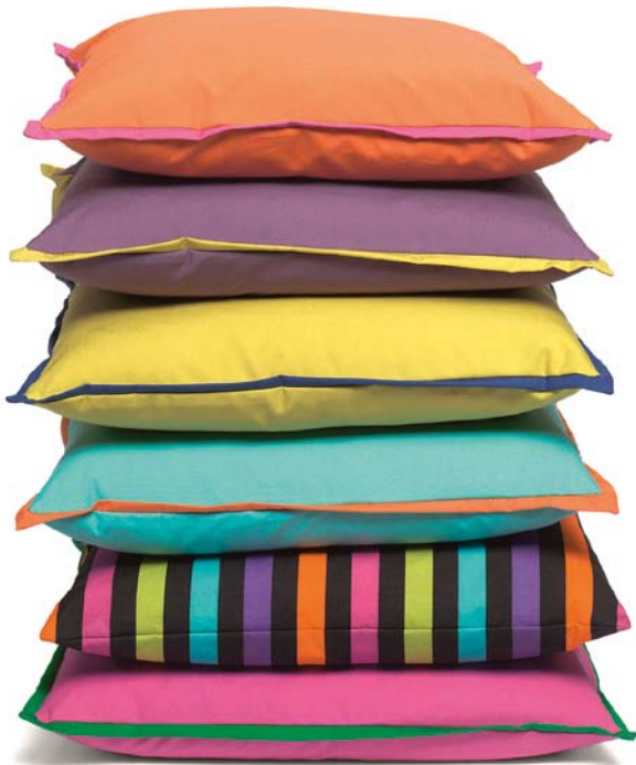
Gute-Laune-Popeline: Streifen „Rodeo“, 101 Euro, stellt satte fünf Farben zur Schau, während Uni „Logo“, 45 Euro, seidenmatt glänzt (Nya Nordiska)